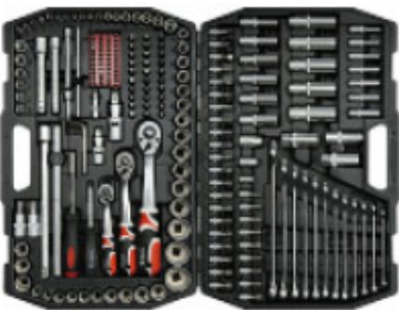
Zestaw kluczy 216 części