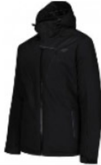
Kurtka męska zimowa