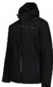
Kurtka męska zimowa