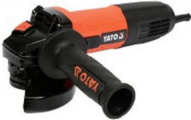
Szlifierka kątowna Yato