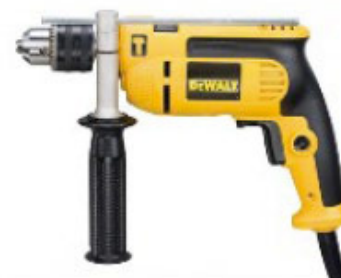
Wiertarka udarowa DeWalt