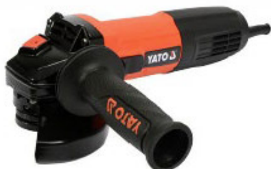
Szlifierka kątowna Yato