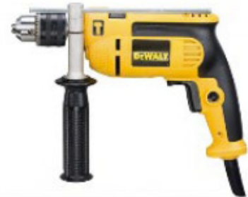
Wiertarka udarowa DeWalt