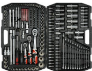
Zestaw kluczy 216 części