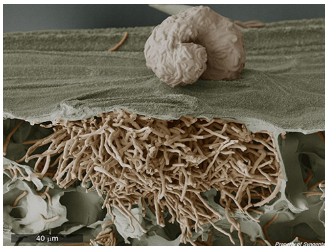
Septorioza na pszenicy 20 dni po infekcji

SOLATENOL™ charakteryzuje się niezwykle wysoką skutecznością przeciwko najważniejszym chorobom grzybowym w zbożach, a przede wszystkim septoriozie i rdzom . Syngenta, jest jedną z nielicznych firm posiadających produkt z grupy SDHI zarejestrowany w Polsce do walki z rdzą żółtą w pszenicy ozimej i jedyną posiadającą produkt SDHI zarejestrowany w pszenicy jarej przeciwko rdzy żółtej. Biorąc pod uwagę fakt, że w sezonie 2017 rdza żółta stanowiła istotny problem na plantacjach pszenicy, Solatenol może w kolejnym sezonie okazać się niezbędnym elementem programów ochrony pszenicy.