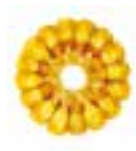
kolba typu flex